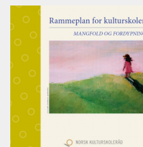
Rammeplan for kulturskolen