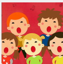
340 sanger på nettstedet