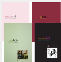
Veilednings- bøker kan