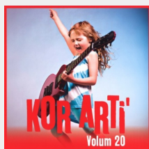
Kor Arti'- materiell